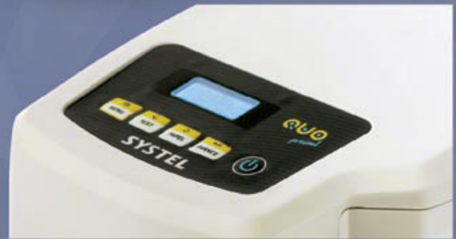
Menú de usuario en pantalla