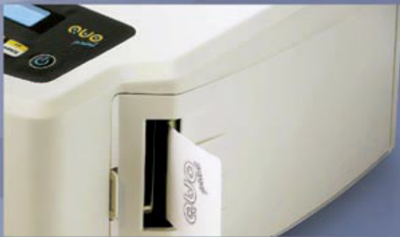
Impresor protegido y robusto.